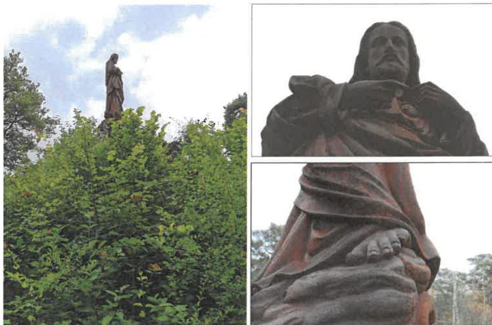
Statue du Sacré-Cœur, domaine du château de Moignanville

Buno-Bonnevaux fut, des années 1870 aux années 1960, le centre d'un actif pèlerinage. Celui-ci était voué à la célébration du Sacré-Coeur de Jésus, promue par une religieuse de Paray-le-Monial (Saône et Loire), Marguerite-Marie, canonisée en 1920. La procession se dirigeait vers la colline de Moignanville où le baron de Limnander, propriétaire du château de même nom, avait édifié une monumentale statue qui avait remplacé une simple croix de bois. Ce pèlerinage aussi dit de « Saint Guerluchon » attirait notamment des femmes désireuses d'enfanter. Elles devaient frotter les orteils du saint afin d'espérer voir leur vœu exaucé.