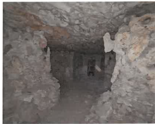
Grotte, domaine du château de Moignanville

Ces deux éléments se situent dans le domaine du château de Moignanville, sur la commune de Buno-Bonnevaux.