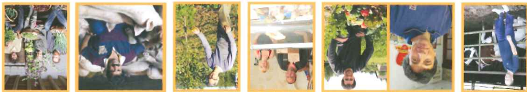
Produits laitiers Marniers Maraisiers Volailles Arboretteur Eleveur porcins Maraisiers